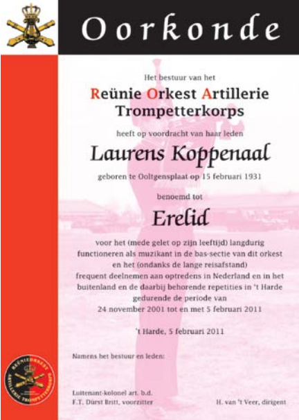
De oorkonde die Laurens Koppenaal kreeg uitgereikt op 5 februari 2011 (ontwerp: Jakob Brouwer)