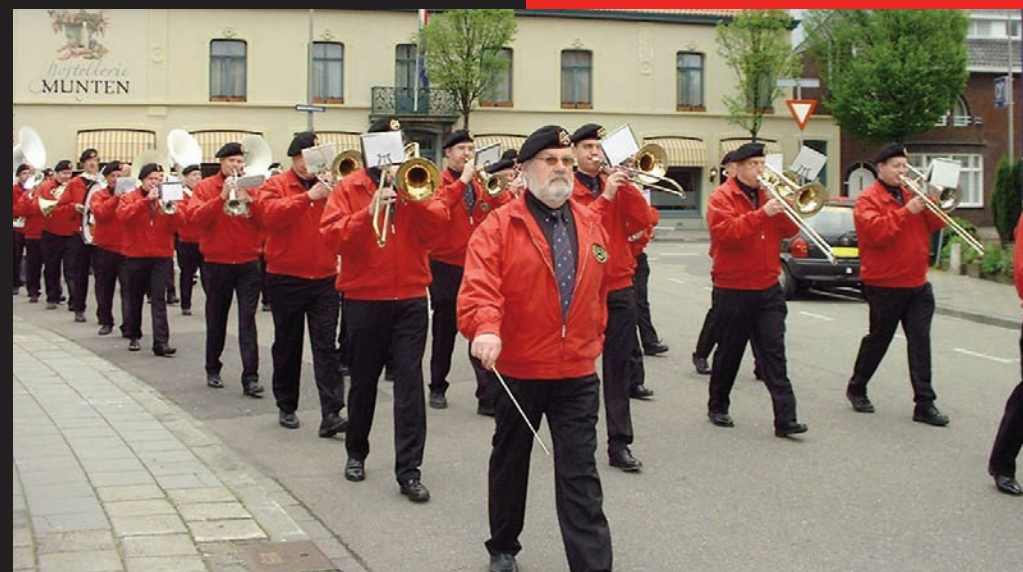
Het allereerste optreden van het ROA in Weert op 19 april 2002 ter gelegenheid van de jaarvergadering van de VOA.

10 jaar Reunie Orkest Artillerie Trompetterkorps opgericht 24 november 2001 www.reunieorkestartillerie.tk